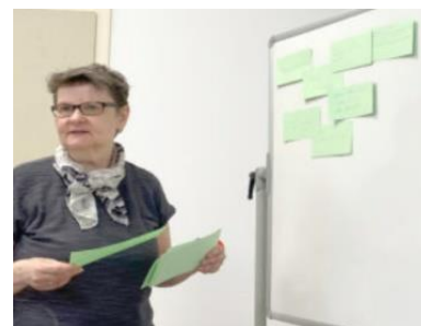
Abbildung 4: Multiplier-Event in Belgien